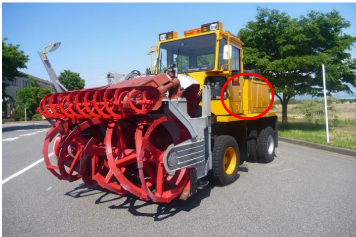
「ニイガタNR302ロータリ除雪車」