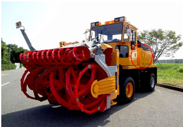
「ニイガタNR303ロータリ除雪車」