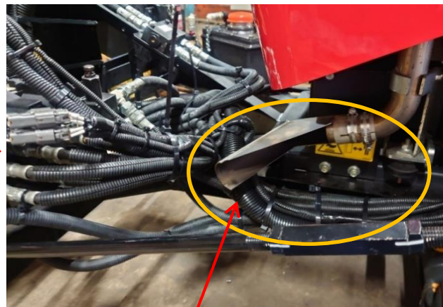
基準不適合発生箇所