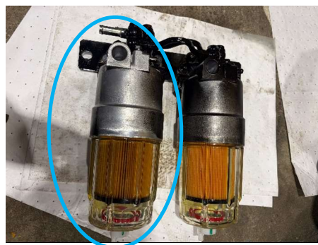
燃料プレフィルター