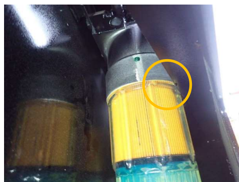
リアフェンダーとの干渉状態